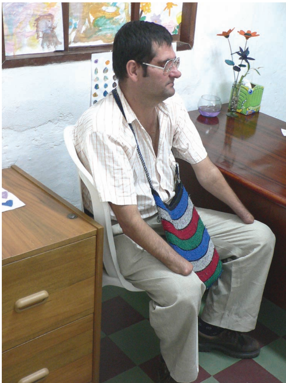
E dilberto perdió la vista en un ojo y sus manos debido a una mina terrestre. Sus heridas lo obligaron a abandonar el campo y ahora vive de la caridad pública en la ciudad.

Algunas veces, adultos activos terminan dependiendo de sus propios hijos, desarrollando depresión y sentimientos de inutilidad. “Yo vivo muriéndome,” nos dijo un agricultor, de unos cincuenta años de edad, quien perdió una pierna y casi toda su visión cuando pisó una mina antipersonal cuatro años antes. “Venía de